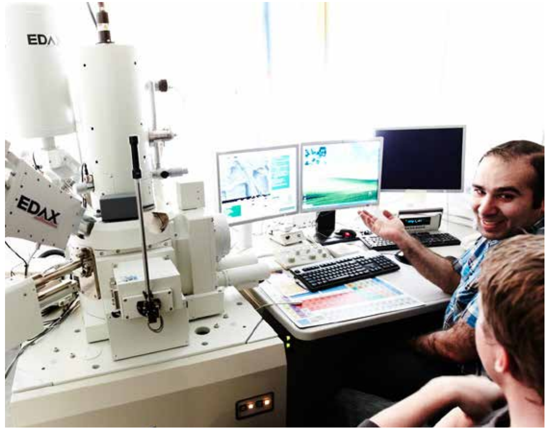
Produktion, proteser och industriell produktframtagning är i fokus i de tre första forskningsprojekten som nu startar inom högskolans, Regionförbundets och företagets nya samarbete.