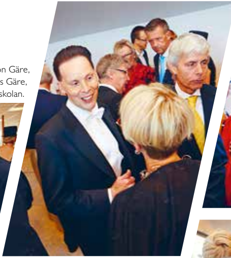
Mats Green, nyvald riksdagsledamot för Jönköpings län.